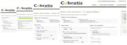
Fig 3: Fase Extrajudicial.

Desde el departamento de gestión de cobro, nuestros profesionales del recobro inician todos los mecanismos extrajudiciales necesarios para la recuperación de su deuda, previos a la vía judicial.